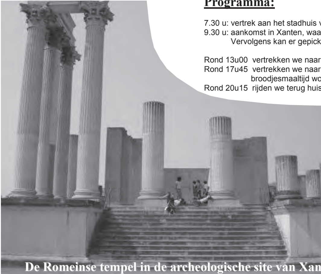
De Romeinse tempel in de archeologische site van Xanten