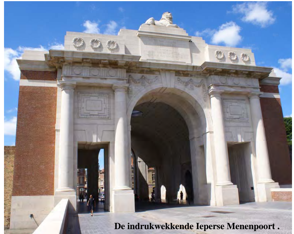
De indrukwekkende Ieperse Menenpoort .