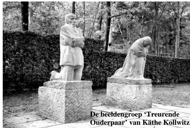
De beeldengroep 'Treurende Ouderpaar' van Käthe Kollwitz.