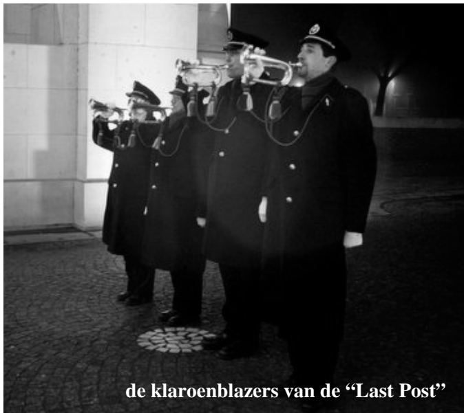
de klaroenblazers van de "Last Post"

Gidsen zorgen de ganse dag voor begeleiding en toelichting en bovendien reist de groep 'Les Voix Perdues' met ons mee voor aangepaste omkadering met tekst en muziek.