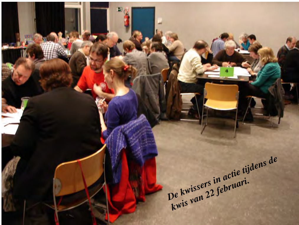
De kwissers in actie tijdens de kwis van 22 februari.