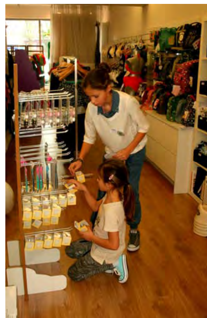
Mammies & Pappies'