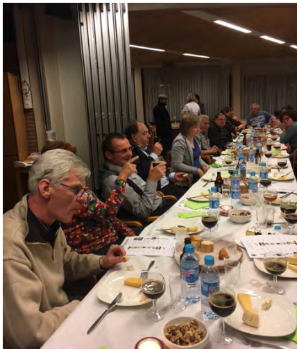
Bier & kaas proefavond