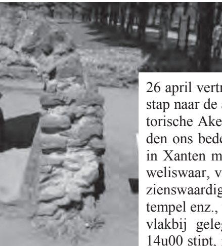
Gezinsuitstap vrijdag 26 april jl.