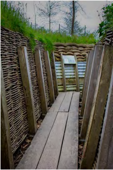
De reconstructie van de loopgraven in het vernieuwde museum van Passendale.