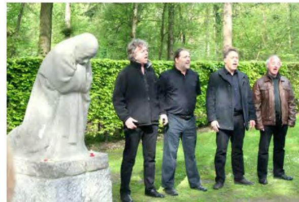
Een ontroerend moment met 'Les Voix Perdues' bij de Treurende Moeder van Käthe Kollwitz in Vladslö.