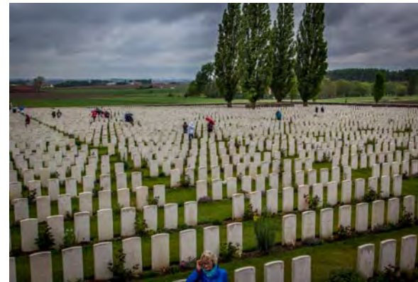
Het immense Britse kerkhof 'Tyne Cot' te Passendale.