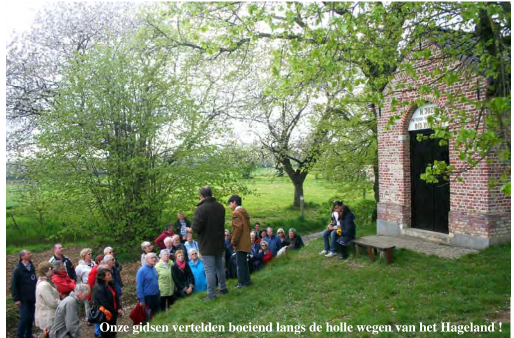
Onze gidsen vertelden boeiend langs de holle wegen van het Hageland !