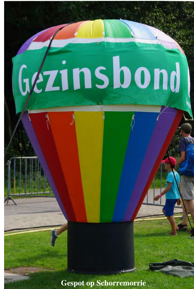
Gespot op Schorremorrie